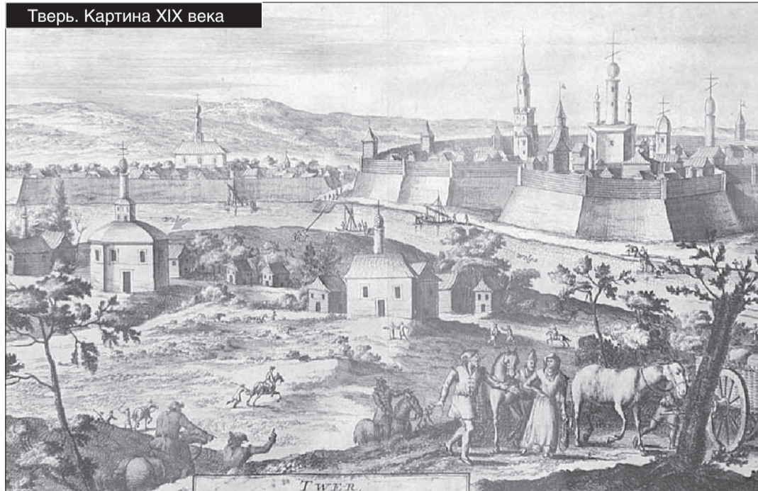
Тверь. Картина XIX века

Гастрономический фестиваль «У Пожарского в Торжке...» проходит в Тверской области с 2016 года. В 2017-м событие заняло третье место в номинации «Лучшее деловое мероприятие» в финале Национальной премии в области событийного туризма Russian event awards.