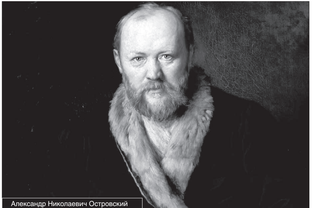
Александр Николаевич Островский

— Все лучшее тверское общество гуляло на набережной. Много красивых женских лиц, впрочем, половина подкрашены. Барышни-купчихи одеты по моде, большею частью в бархатных бурнусах, маменьки их в темных салопах и темных платьях и в яркорозовых платках на голове, заколотых стразовыми булавками, что неприятно режет глаза и совсем нейдет к их сморщенным старческим лицам, напоминающим ростопчинских бульдогов.