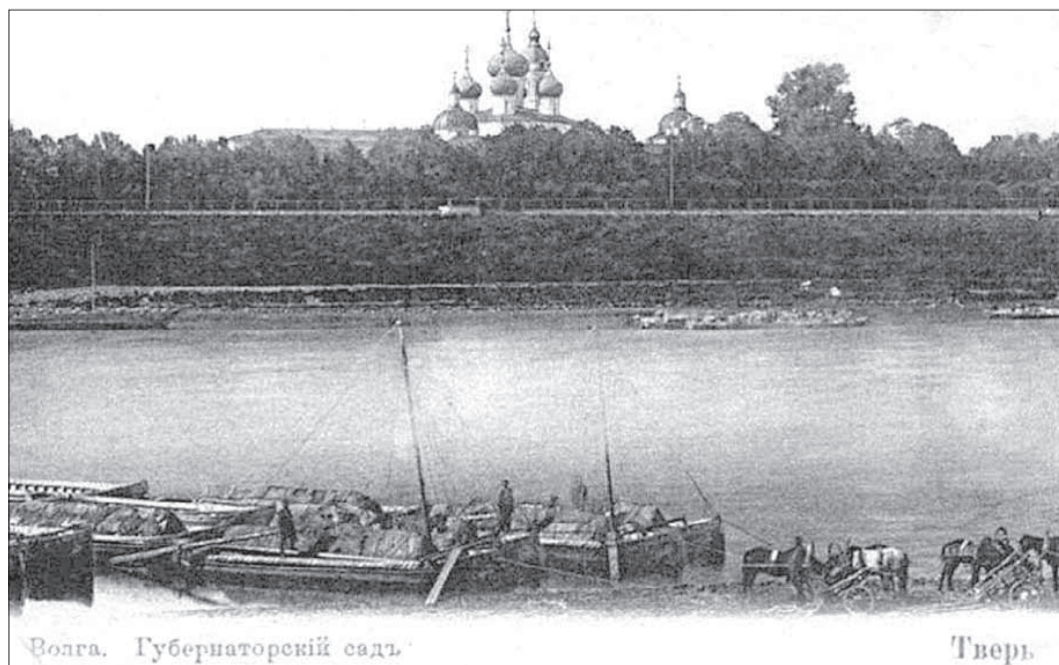
Волга. Губернаторский сад.

— Город красиво построен и счастливо поставлен на перекрестке путей железного и водных. Но мне довелось убе-